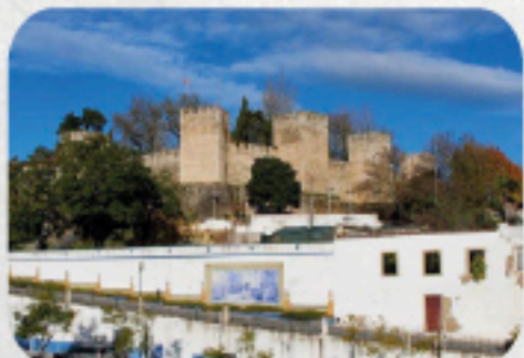
Castillo Torres Novas